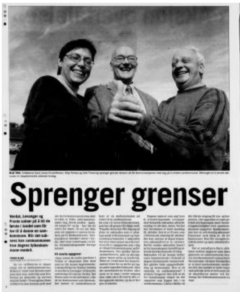
Trønder-Avisa 14. oktober 2002

Samkommunen ble etablert som et felles prosjekt etter forsøksloven for kommunene Levanger og Verdal den 1. februar 2004. Inntil samkommune i 2012 ble innarbeidet som samarbeidsform i kommuneloven, ble Innherred samkommune drevet som forsøksprosjekt.