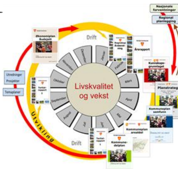
Figur 1 Plan- og styringssystemet